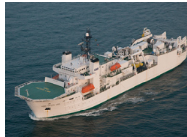
KDDI パシフィックリンク

新しい海底ケーブル敷設船は、通信ケーブルの敷設及び修理で培ったノウハウを用いることで、これまでの通信ケーブル、観測・資源探査ケーブルに加え、日本で初めて（注1）、電力ケーブル工事への対応が可能となります。