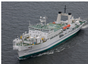
KDDI オーシャンリンク

KCS は、1967 年よりケーブルハンドリング機器を装備した海底ケーブル敷設船を、太平洋・アジア域に広がる光海底ケーブルネットワークの建設・保守に活用しており、現在は KDDI オーシャンリンク、KDDI パシフィックリンクの2隻を運用しています。