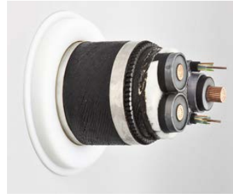
電力ケーブル(約 200mm)